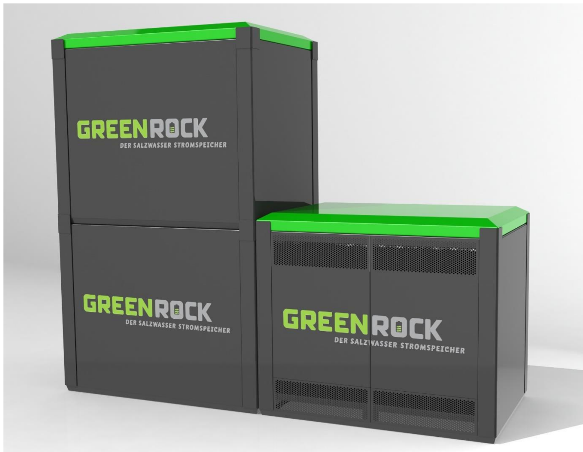
GREENROCK Business 60 kWh